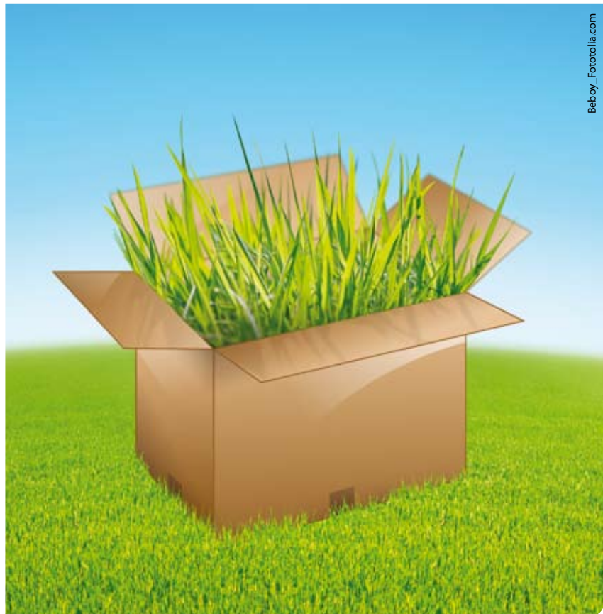
Das Grüne Haushaltspaket für mehr Klimaschutz und Bildung

Personal- und Sachkosten in der Verwaltung und beim „Schleswig-Holstein-Fonds“ sparen. Und wir fordern, dass